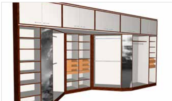
Planejamento de móveis com material definido