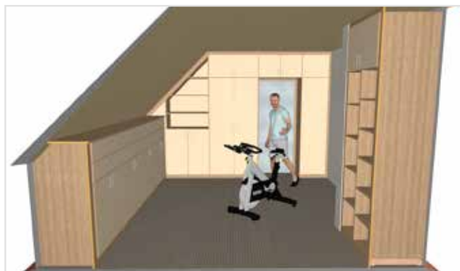
O projeto de toda a instalação para seus ambientes facilitado com o SmartWOP